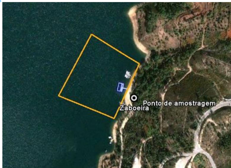
Figura 1 - Água balnear e ponto de amostragem (LAT 39.704362º, LONG -8.222675º, ETRS89) Figure 1 - Bathing water and sampling point (LAT 39.704362º, LONG -8.222675º, ETRS89)

Concelho: Vila de Rei Código Água Balnear: PTCU7P Bacia Hidrográfica: Bacia Hidrográfica do Rio Tejo Massa de água: Albufeira de Castelo de Bode ÉPOCA BALNEAR 2024: 15 Junho a 15 Setembro Frequência de amostragem: Quinzenal