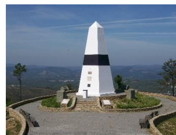
Centro Geodésico de Portugal

Limitado a norte pela ribeira da Isna, a sul pela ribeira do Codes e a oeste pelo Rio Zêzere, o concelho assume-se como uma península, o que lhe atribui características específicas bem expressas na paisagem. Caracteriza-se por um território bastante montanhoso, atingindo altitudes próximas dos 600 metros, como é o caso da Serra da Melriça, ex-libris concelhio por albergar o Picoto da Melriça – Centro Geodésico de Portugal.