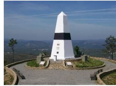
Centre Géodésique de Portugal

Le territoire est très montagneux et culmine à 600 mètres, dans le massif Melriça, ex-libris de Vila de Rei, où se situe le Picoto de Melriça – Centre Géodésique de Portugal.